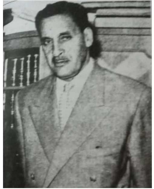
فرحات عباس. 2