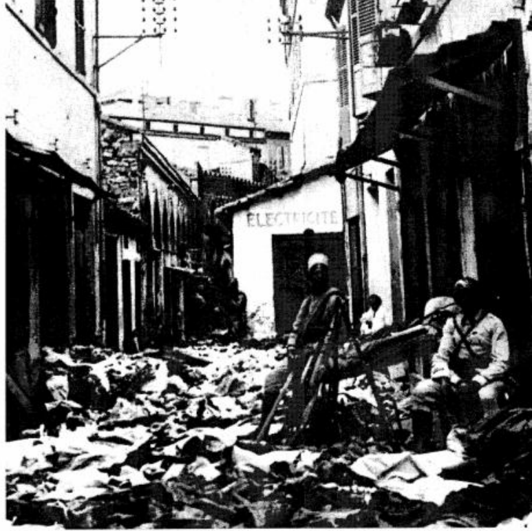
الحي اليهودي بتسنطينة أثناء حوادث عام 1934 - 1934/8/5