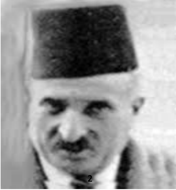
ابن جلول 1