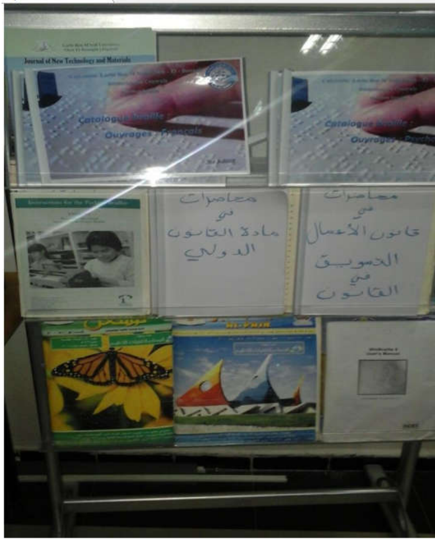
الرصيد الوثائقي بمكتبة العربي بن مهدي