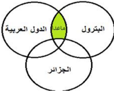
الشكل رقم: 03

الرابطة المنطقية 'ماعدا' تختلف مسمياتها خصوصا في بعض محركات البحث العربية ، ويعبر عنها عادة برابطة (ليس / لا / لا تتضمن / لا تحتوي على الكلمات) ويقابلها باللغة الإنجليزية رابطة (NOT) وتستعمل بعض محركات البحث العربية والعالمية الرمز (-) بدلا من (ليس / ماعدا/ لا / NOT) لتؤدي نفس الوظيفة، وهذه الرابطة تستخدم في تضيق نطاق البحث. يتم التعبير عن هذه العلاقة في الشكل رقم 03.