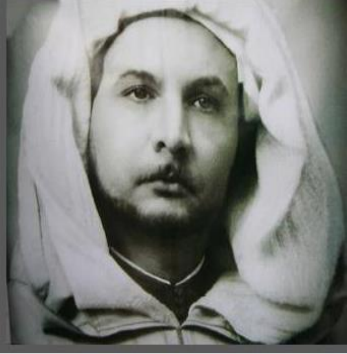
الملحق رقم 01: صورة علال الفاسي في الأربعينيات 1