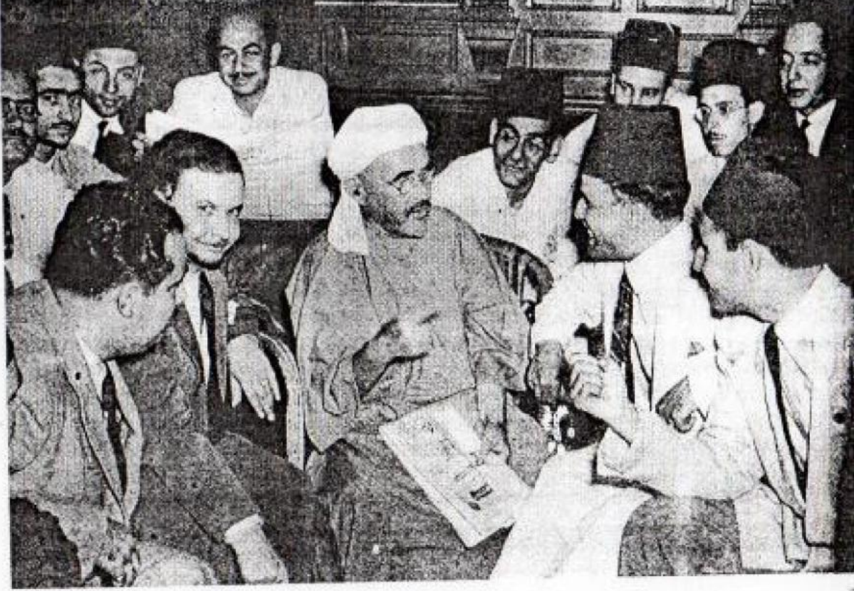
الأمير عبد الكريم الخطابي اثر وصوله الى القاهرة مع زعماء المغرب العربي في مكتب المغرب العربي الى بساط الأمير الرئيس الحبيب بوهقيبة ( تونس ) السيد الشاذل المتوي ( الجزائر ) والي يمينه الاستاذ علال الفاسي ( المغرب الأقصى ) والاستاذ عبد الخالق الطريس . ( المنقطة الشمالية بالمغرب الأقصى ) ( 1947 )

الملحق رقم 03 : صورة و وصول الأمير عبد الكريم الخطابي إلى مصر رفقة المناضلين المغاربة من بينهم علال الفاسي 1