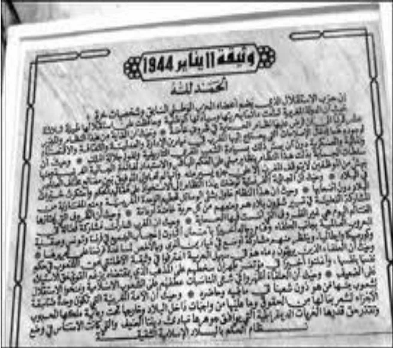
الملحق رقم 02: الوثيقة الأصلية للمطالبة بالاستقلال للحزب الاستقلال المغربي 1