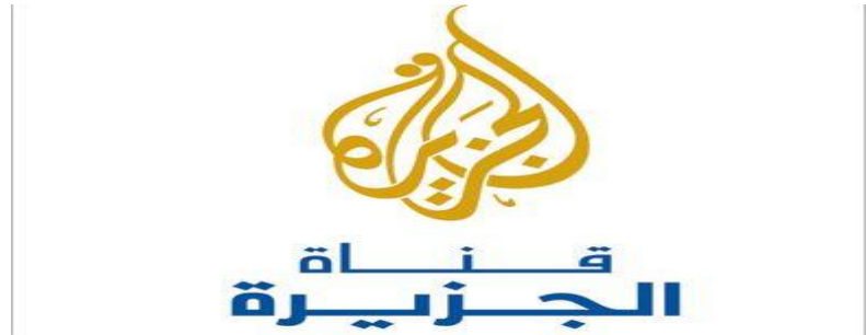
شكل 2 شعار قناة الجزيرة

شهد عقد التسعينيات من القرن العشرين تطورا لافتا في القنوات الفضائية العربية ، حيث أسست و انطلقت العشرات من الفضائيات المتنوعة في الفضاء الإعلامي العربي معظم هذه الفضائيات كانت فضائيات متنوعة تبث برامج إخبارية و اقتصادية و ثقافية و ترفيهية و رياضية و غيرها ، كما ظهرت قنوات متخصصة بالرياضة و الاقتصاد و الدين ، أما التطور الأهم فكان انطلاق قناة الجزيرة الإخبارية كأولى قناة إخبارية في العالم العربي.