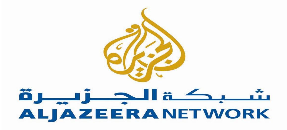
شكل 1 شبكة الجزيرة