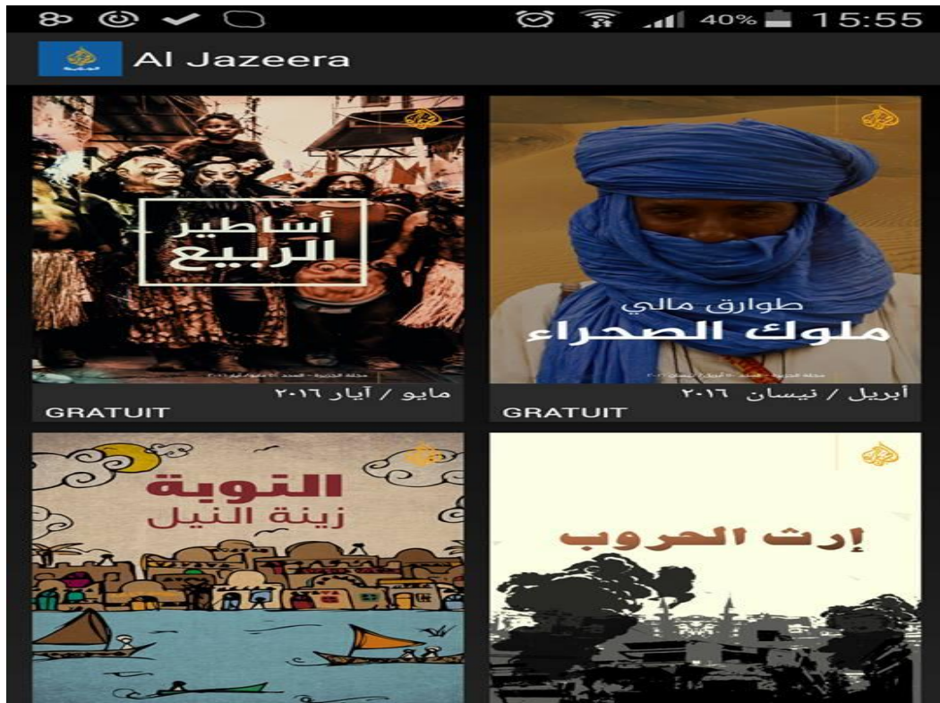
شكل 4 واجهة مجلة الجزيرة على الهواتف الذكية

تقدم مجلة الجزيرة خدمة إعلامية تثقيفية بعيدا عن المتابعات الإخبارية اليومية، فتعنى بالظواهر الاجتماعية وثقافات الشعوب والقصص الإخبارية، كوجبة معرفية خفيفة غنية بالصور، وتستخدم مقاطع الفيديو حيثما أمكن.