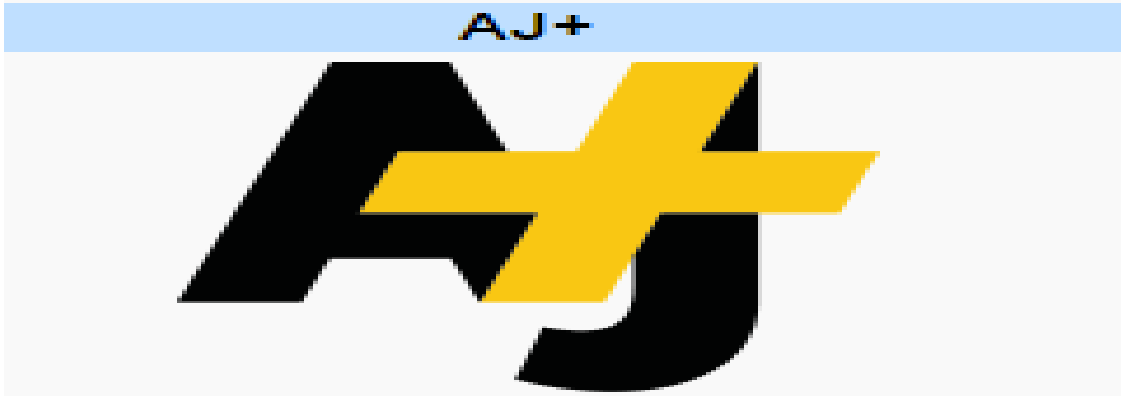
شكل 1 شعار تطبيق أجي+

أجي+ هو تطبيق للأخبار على الانترنت وقناة الأحداث الحالية التي تديرها شبكة الجزيرة للإعلام متاح التطبيق لخدمات الهاتف النقال على الاندرويد و (اي او اس ) كما يتواجد على مواقع التواصل الاجتماعي يوتيوب، الفايسبوك و انستغرام و تويتر مع محتوى مكتوب ،متوفر التطبيق باللغتين الانجليزية و الاسبانية على الهواتف و اللوحات الذكية بينما واجهته باللغة العربية لا تزال قيد التطوير رغم انطلاقها في 2015 و بدأ العمل على التطبيق في ديسمبر كانون الأول عام 2012، بعد فترة وجيزة من تأسيس قناة الجزيرة مكتبا في سان فرانسيسكو ثم تم إنشاء حساب للتطبيق على يوتيوب في 17 كانون الأول 2013، استجابة لتزايد شعبية المحتوى الإخباري على الانترنت بين الشباب. وكان الانطلاق الكامل في 15 سبتمبر 2014 تنتج أجي+ الفيديو الرقمي والوسائط مباشرة للمنصات الاجتماعية (الفيسبوك، يوتيوب، تويتر و الانستغرام) على الاندرويد، يعتبر التطبيق منفصل عن القنوات الفضائية الأخرى لقناة الجزيرة برغم انه يتشارك بـ 68 مكتبا مع مكاتب قناة الجزيرة. 1