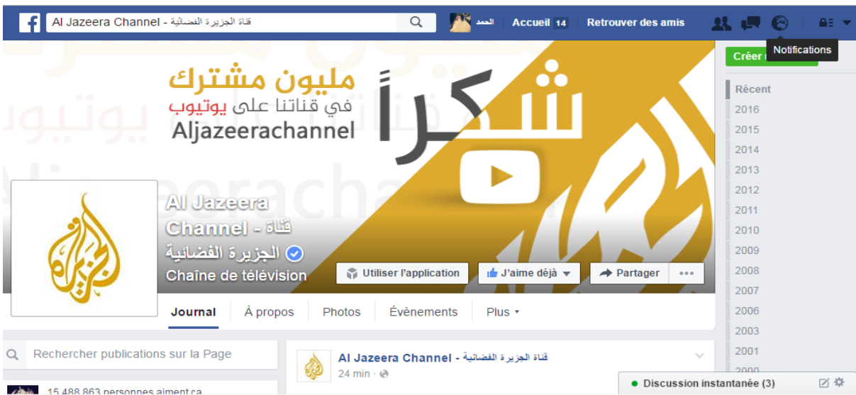
شكل 5 صفحة الجزيرة على الفيسبوك

ب- الجزيرة على مواقع التواصل الاجتماعي :