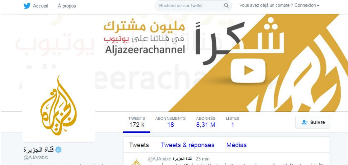
شكل 6 صفحة الجزيرة على تويتر