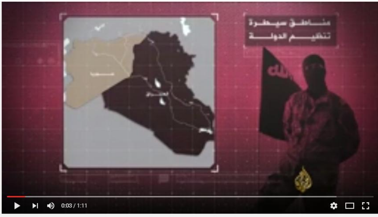
مناطق السيطرة والانحسار لتنظيم الدولة في سوريا والعراق