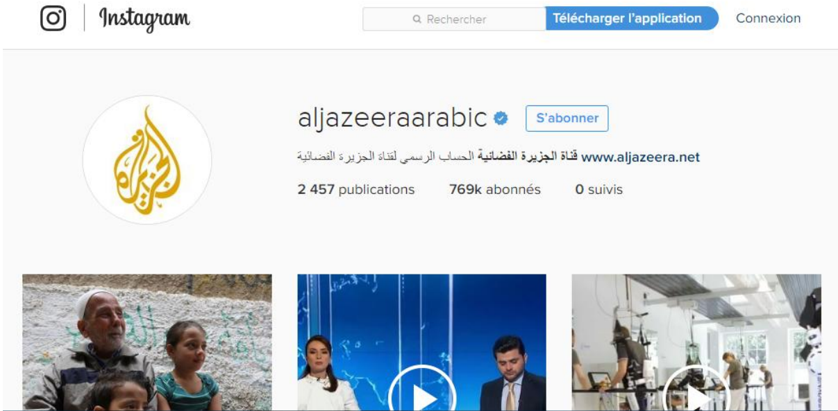
شكل 7 صفحة الجزيرة على الانستغرام