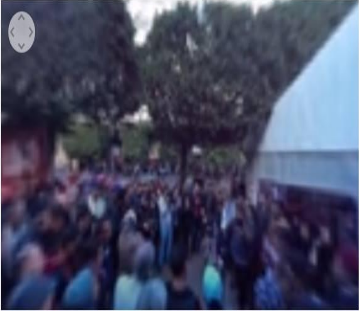
الجزيرة 360 - الاحتفالات بالذكرى الخامسة للثورة بشارع بورقيبة وسط العاصمة تونس