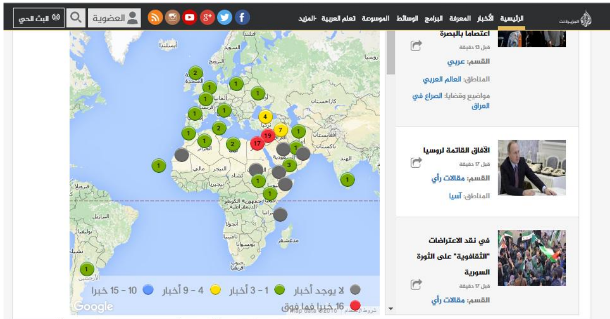
شكل 3 :التصميم الجغرافي في موقع الجزيرة