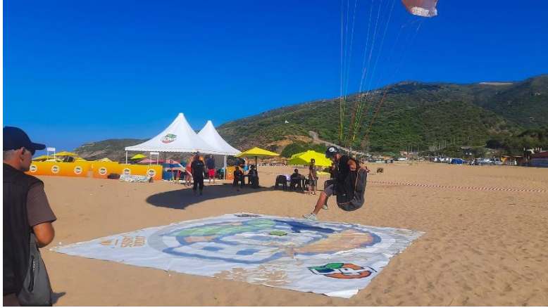
الشكل رقم 03 : أول بطولة وطنية للطيران الشراعي بولاية تيزي وزو 2016 المصدر

https://www.facebook.com/photo.php?fbid=878682640928428&set