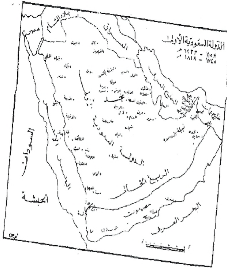
خريطة توضح مناطق نفوذ الدولة السعودية الأولى (46)