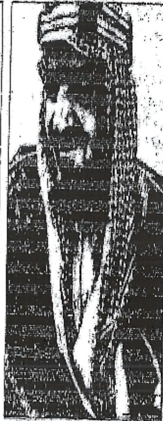
(50) خراب البعبينة: مولانا الشيخ محمد بن عبد الوهاب والد «السلفية» الحديثة.