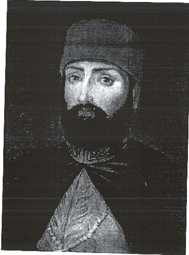
صورة محمود الثاني (51)