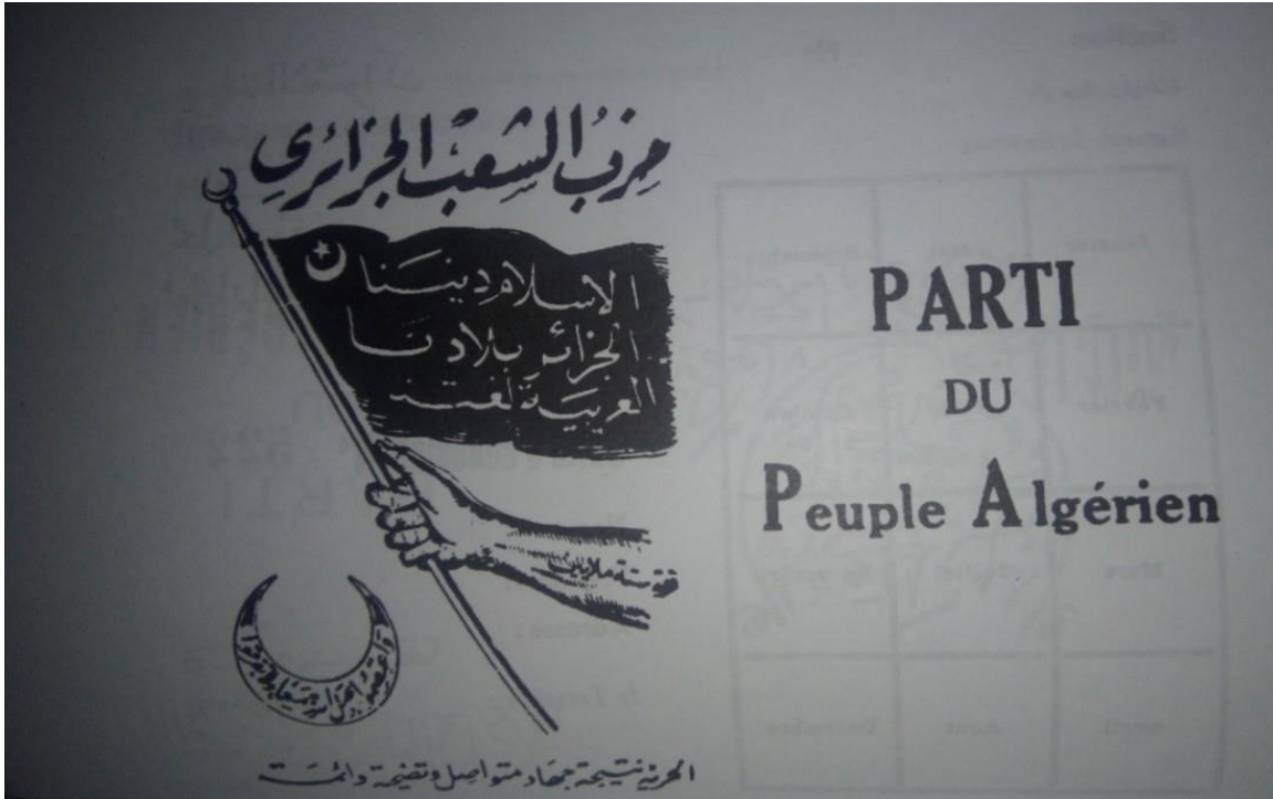
الملحق رقم 05: شعار حزب الشعب 1