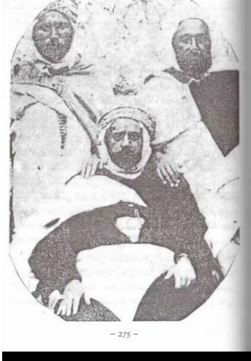
الملحق رقم 04: صورة الأمير خالد 1