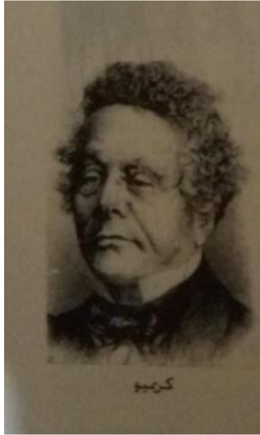
الملحق 01: صورة كريميو 1