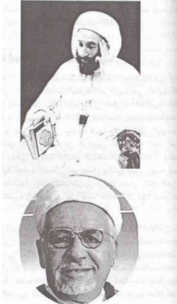
الملحق رقم 06: صورة ابن باديس 1