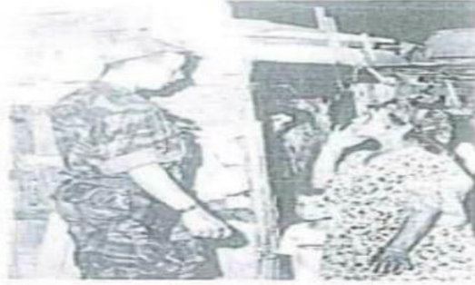
المطلوبون يتحصنون البيوت