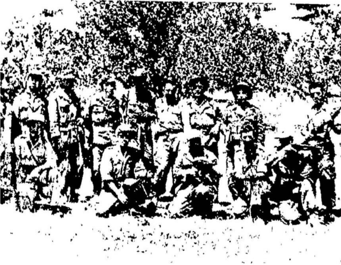
المؤتمرون برادى الصمام لى ٢٠ أغسطس ١٩٥٦

المصدر: فتحي زيب، عبد الناصر وثورة الجزائر، الطبعة الثانية، دار المستقبل العربي، القاهرة، مصر، 1990، ص 246.