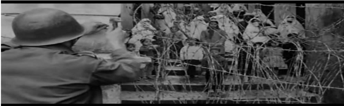
فتح المحلات بالقوة.

المصدر: هاجر نهاص، المرجع السابق، ص 195.