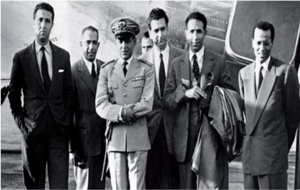
صورة من التلفزة المغربية مارس 1962

قادة الثورة الجزائرية الذين اختطفتهم القوات الفرنسية