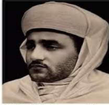
محمد الخامس بن يوسف 1927 1961 م

ملك المغرب من سلالة العلويين، تولى العرش 18 أوت 1927 وحتى وفاته في 26 فيفري 1961، عاصر ذروة السيطرة الاستعمارية الفرنسية على بلاده، لكنه وثق الصلة مع الحركة الوطنية من أجل جلاء المستعمر، تعرض للنفي 1953 ثم عاد بضغط شعبي عارم يوم 16 نوفمبر 1955 ليعلن استقلال بلاده، ويضع الأسس الأولى للدولة الحديثة بالمغرب.