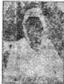
وهمم الوسامم الذكر طرفة محمد شكيب ارسلان

لو أراد الله لكان العالم الاسلامي امبراطورية واحدة ومملكة عظيمة غير عمراء ولا موزعة كما كان أيام المغلابة الراشدين، ولكن التفرقات الحزبية والاختلافات المعنوية والافراض الشخصية تعذرت على توفيق هذا البناء الشامخ، حتى كانت تأتي عليه من أسامة لولاً ما يحبه من قوة روحية وتعاليم يدين بها تارة ان يكون جبر امة اخرجت للناس، فهدمها لهدم به الامم، والطوائف لم تستطع ان تهدم شئ من شئ، بل لأنه ان يتفق منها كأني الوشم في ظاهر اليد، وتلك البقعة البيضاء التي