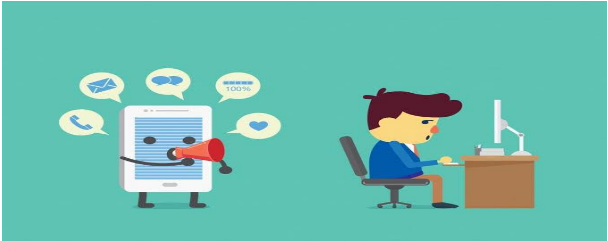
صورة توضح تأثير الطالب بالمشتتات الجانبية