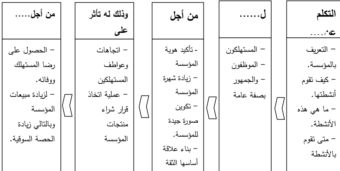
الشكل: مسار العلاقات العامة للتأثير على سلوك المستهلك

عند تتبع مسار العلاقات العامة في التأثير على سلوك المستهلك نلاحظ مساهمة فعالة للعلاقات العامة في مد الجسور لإقامة العلاقات بين المؤسسة ومستهلكيها والجمهور بصفة عامة، والمساهمة أيضا في تكوين الصورة اللاتقة عن نشاطاتها وسياساتها، كما تساعد على فهم حقيقة المؤسسة كعضو فعال في المجتمع، وبما أن العلاقات العامة تسعى إلى تكوين الصورة الجيدة للمؤسسة وتوضيح هويتها وتحسين سمعتها، فإنها تؤثر تأثيرا غير مباشر على سلوك المستهلك 2 ، وهذا ما يوضحه الشكل رقم (03) :