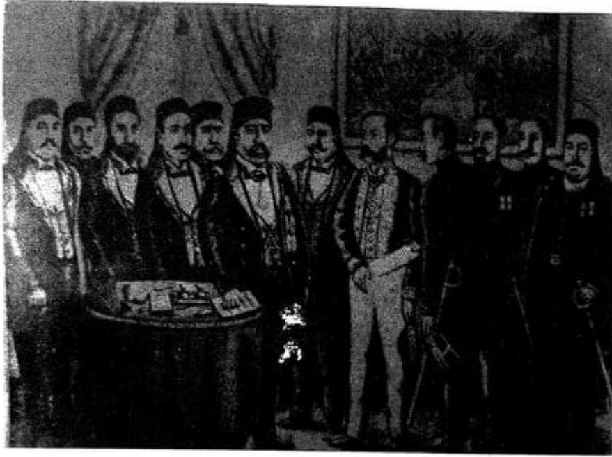
موكب توقيع معاهدة الحماية - قصر السعيد 12 ماي 1881 . (وزارة الإعلام)

(موكب توقيع معاهدة الحماية-قصر السعيد 12 ماي 1881)، احمد قصاب:المرجع