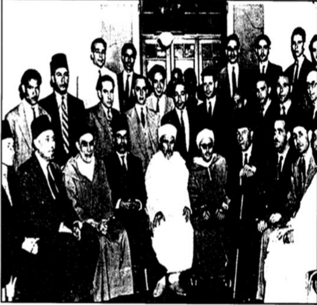
بر في الصورة الزعيم الحبيب بورقيبة على يمين بطل الريف الأمير عبد الكريم الخطابي إثر جؤنه إلى القاهرة في ماي 1947 كما يظهر في أقصى يمين الصف الثاني المناضل الدكتور الحبيب ثامر مدير مكتب المغرب العربي بالقاهرة

خليفة الشاطر وآخرون: المرجع السابق ص119.