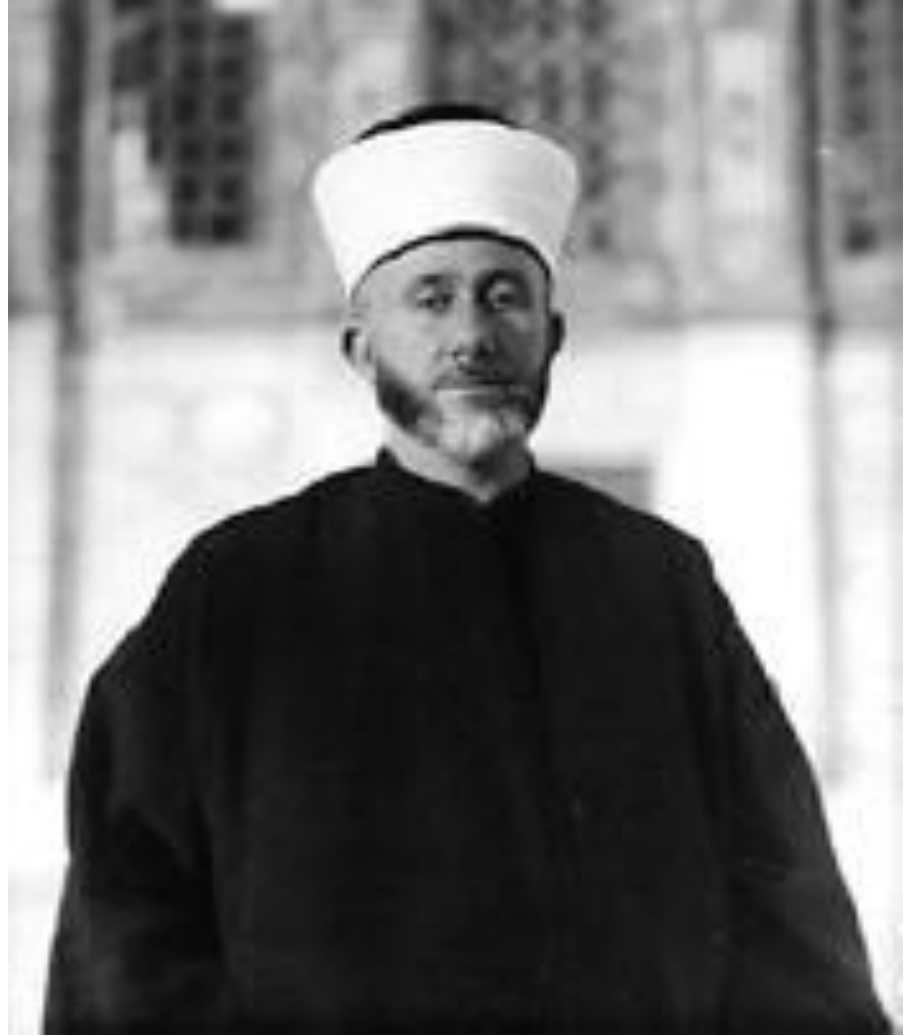
الحاج الامين الحسيني المصدر: د/محسن محمد الصالح: فلسطين، المرجع السابق، ص148.