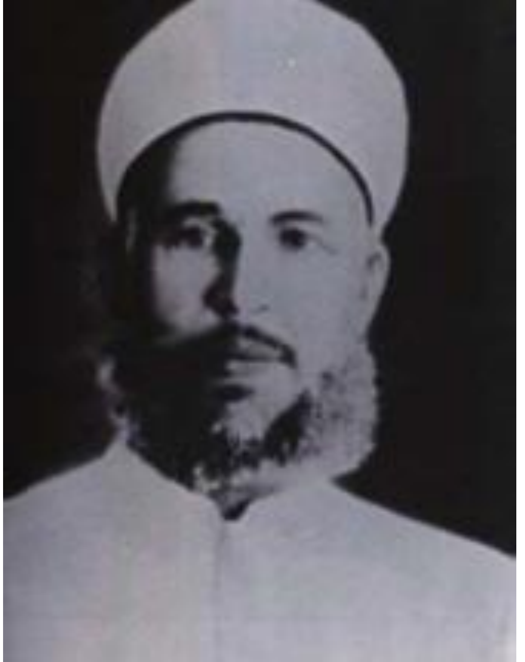
الشيخ عز الدين القسام المصدر: د/محسن محمد الصالح: فلسطين، المرجع السابق، ص148.