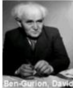
ديفيد بن غوريون