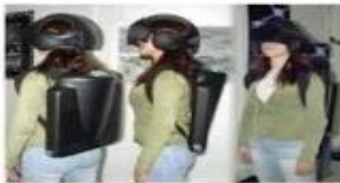
صورة ( 1-1 )