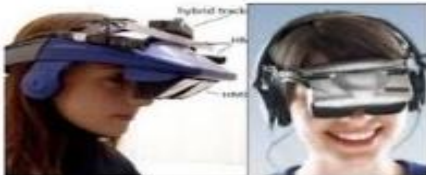
صورة ( 1-1 )