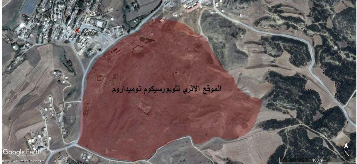
الشكل: 1: صورة جوية لموقع توبورسيكوم نوميداروم

صنفت توبورسيكوم نوميداروم كموقع تاريخي ضمن التراث الوطني في 23 جانفي 1968م بمقتضى قرار رئاسي ثم أعيد التأكيد عليه ضمن القانون 98/04 وهو قانون حماية المعالم الأثرية والتاريخية 1 .