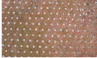
تقنية opus sectile (قراءات في الحفاظ على الفسيفساء ص38)

ومقوماتها من الناحية التقنية هي خليط الملاط الذي كان يتكون قديما من الجير مع الطوب الأحمر المطحون، ويضاف إليه نسبة من كسر الفخار أو قطع الأحجار أو الرخام، ويمكن تلوين هذا الملاط باكاسيد ترابية ملونة، ويفرد على سطح الأرضية بصورة مستوية، وبعد جفافه يصقل ليبدو شكل الحصوات 1 .