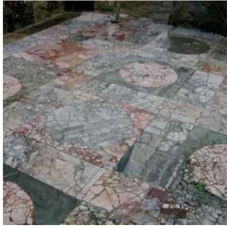
تقنية opus sectil (قراءات في الحفاظ على فسيفساء ص36)