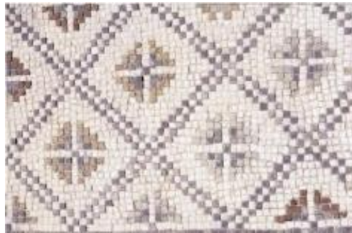
Opus tessellatum (فسيفساء المتحف الوطني، شيخ لونيس ليلة ص 19)

استعملت فيه مكعبات بمقاسات متعددة حسب موقعها في اللوحة، يقدر متوسط ضلع المكعب تقريبا 2سم، ويعد هذا النوع الأكثر انتشارا.