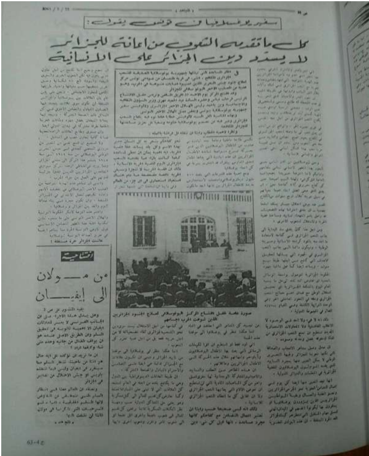
الملحق رقم : 01