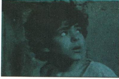
▲ صورة الطفل عمر في فيلم «الحريق»

عمر ظروف الفقر والحرمان التي سلّطت على الأسرة الجزائرية في عهد الاستعمار حينها تذوق مرارة اليأس من تحسّن الأوضاع الاجتماعية؟